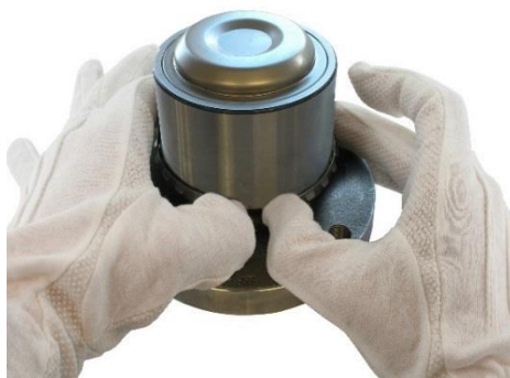
2. Delikatnie rozegnij pierścień.