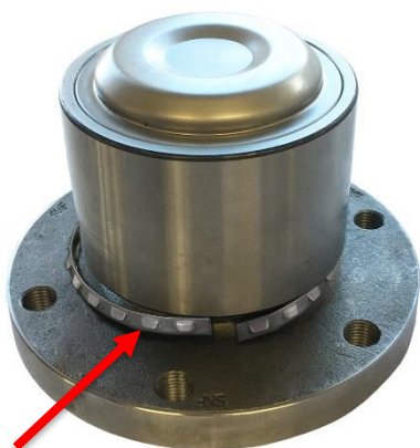
1. Zsunięty pierścień zabezpieczający.