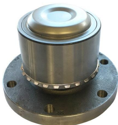
4. Pierścień jest w odpowiedniej pozycji.