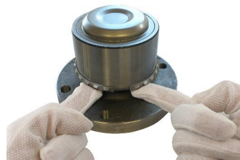
3. Wsuń pierścień na właściwą pozycję.